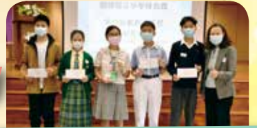
五名剛畢業校友真棒! 榮獲「STEM-UP 香港創新科技大賽— 最佳演繹大獎」。