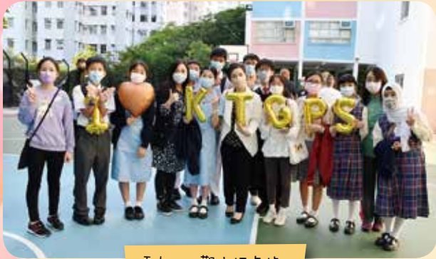
I Love 觀小打卡站。