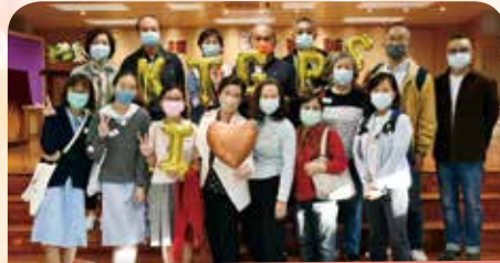
校長+委員+校友齊齊「I Love 觀小」!