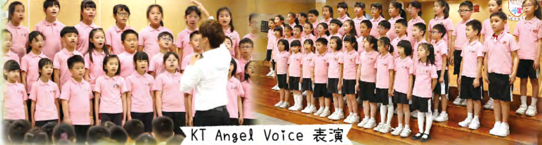
KT Angel Voice 表演