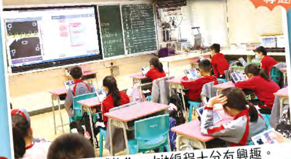
同學都對 Micro:bit 編程十分有興趣。