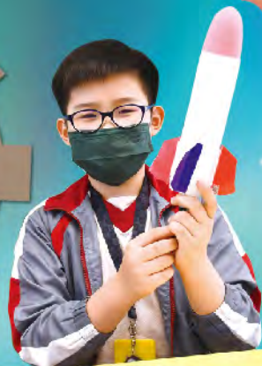
同學製作的「神舟航空冲天汽火箭」。