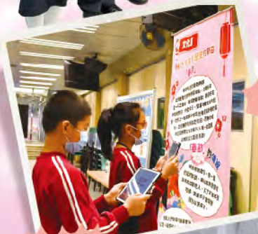
校本國民教育電視台