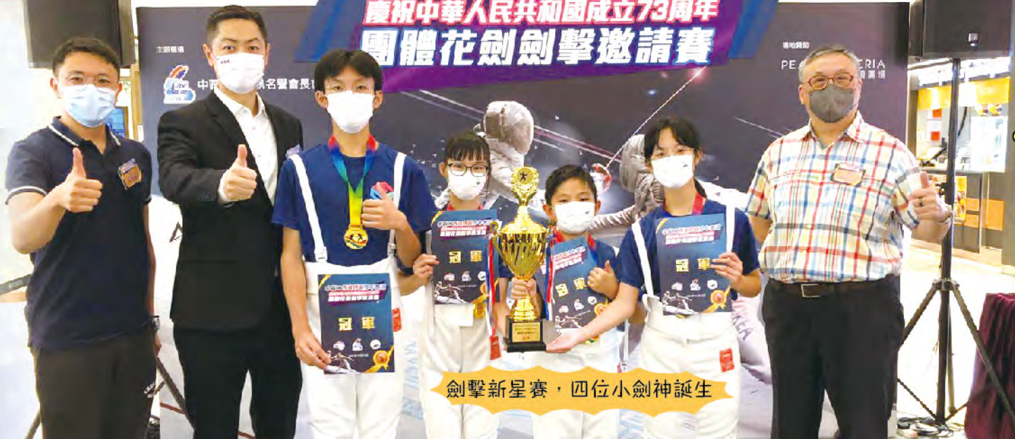
劍擊新星賽，四位小劍神誕生