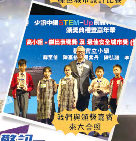
我們與頒獎嘉賓 來大合照