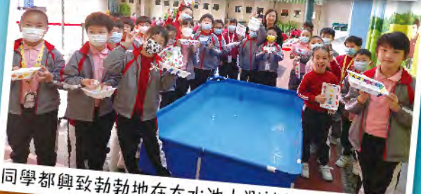
同學都興致勃勃地在大水池上測試自製的小遊艇。

在各級進行 STEAM 跨科專題研習，將 STEAM 元素融入中文、英 文、數學、常識、視藝、電 腦及成長課各學科中，以提 升學生運用和綜合不同學 習領域知識的能力。