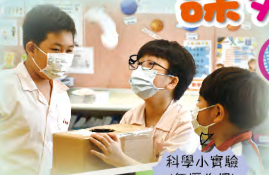
科學小實驗 (氣壓作用)

逢星期五，學校安排了課外活動讓學生參加，活動分為固定組及循環組。為豐富學生的學習經歷，除了安排本校老師，還邀請了校外專業導師，為學生提供專項訓練，提升素質。