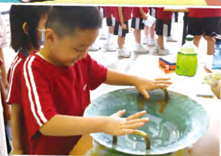
同學寓學習於娛樂當中。