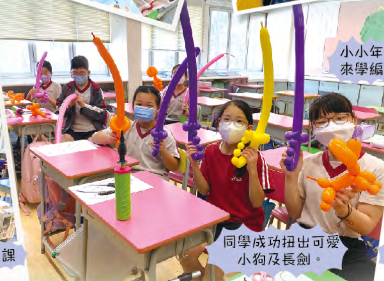
同學成功扭出可愛小狗及長劍。