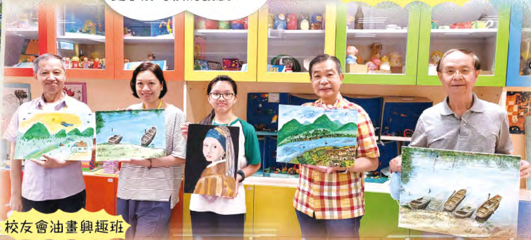
校友會油畫興趣班