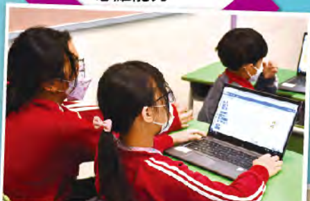
同學用心地學習 Scratch 的編程技術。