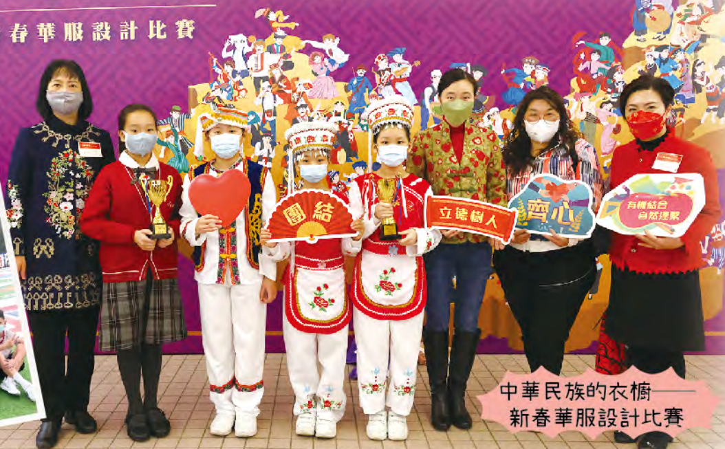
中華民族的衣櫥——新春華服設計比賽