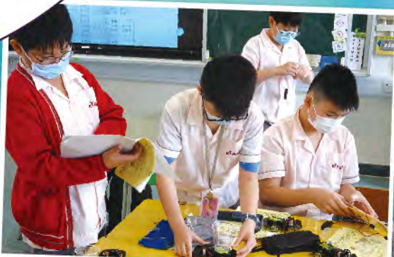
同學正在組裝電動車，用作稍後速度門的測試。