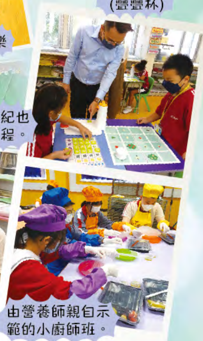
由營養師親自示範的小廚師班。