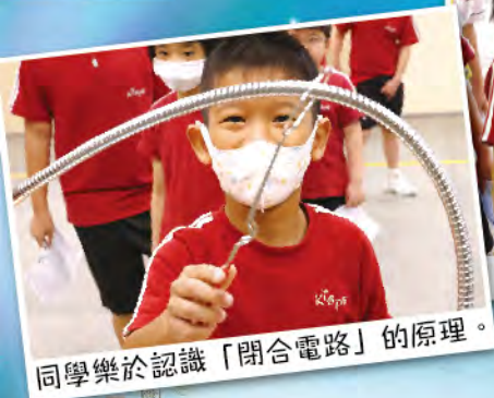
同學樂於認識「閉合電路」的原理。

成立STEAM夢工場小組，並安排他們參加與STEAM有關的課程和工作坊，包括：3D打印機、鐳射切割、物聯網技術等，並安排他們參加不同的STEAM校外比賽，以增加學生的學習經驗和發揮潛能。本校在各比賽中，均獲得優良的成績，例如在少訊中銀STEM-Up創新科技大賽2022中獲得了高小組傑出表現獎、最佳安全城市獎及最受公眾歡迎學校攤位大獎。