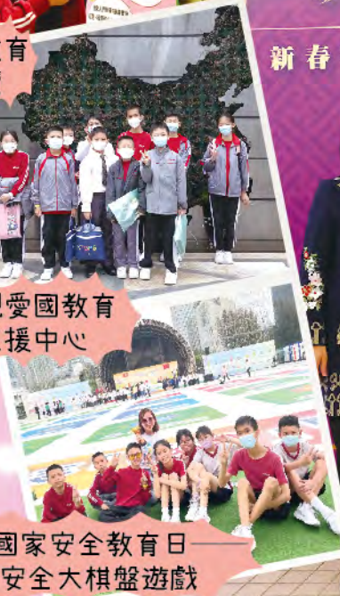
參觀愛國教育支援中心