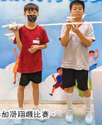
同學準備好飛機參加滑翔機比賽。