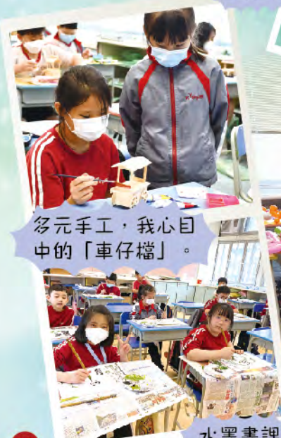
多元手工，我心目中的「車仔檔」。