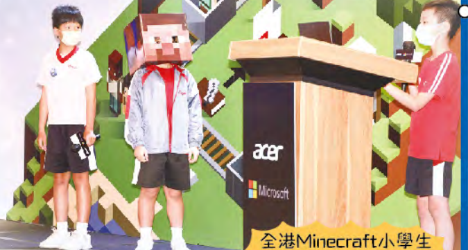
全港Minecraft小學生 綠色城市設計比賽