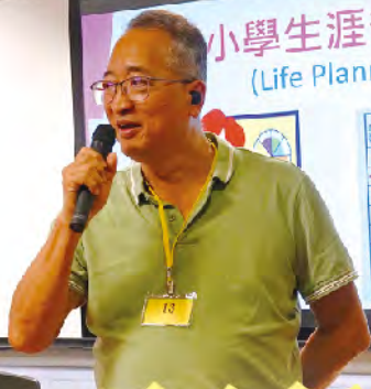
校友會主席為學弟學妹進行生涯規劃講座