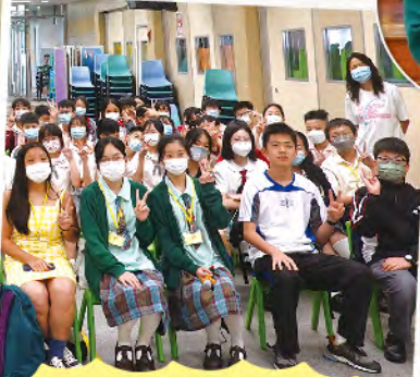
畢業生到校分享中學生活