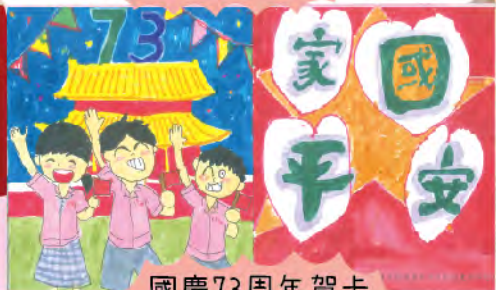
國慶73周年賀卡設計比賽