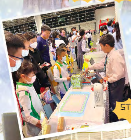
STEM-UP創新科技 大賽暨嘉年華