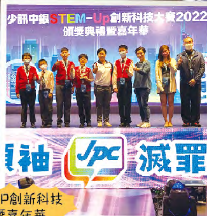
少訊中銀STEM-Up創新科技大賽2022 頒獎典禮暨嘉年華