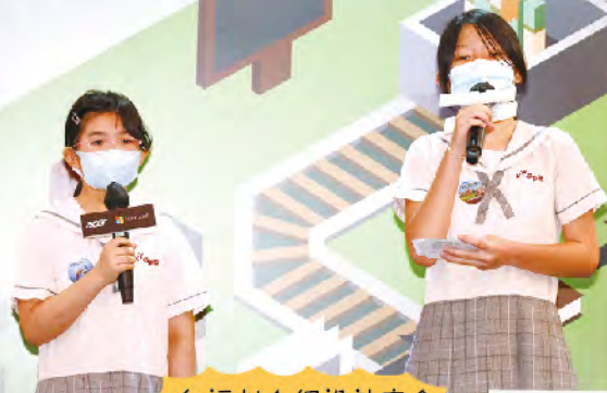
向評判介紹設計意念