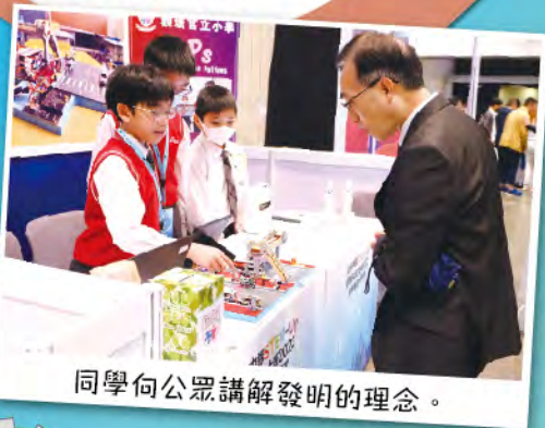
同學向公眾講解發明的理念。