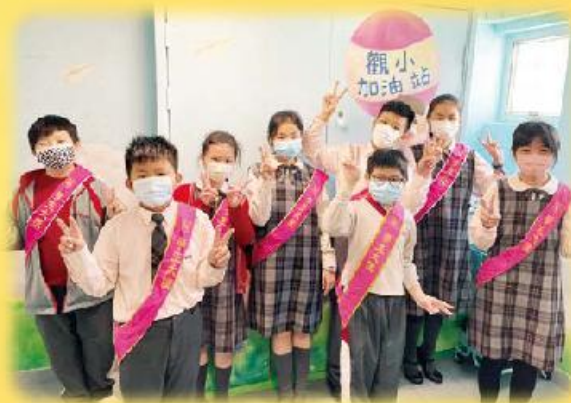
本年度的「學生大使」，他們將為同學服務。