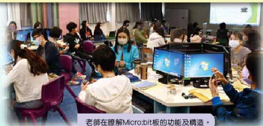
老師在瞭解Micro:bit板的功能及構造。