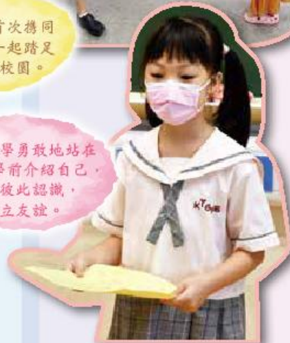
這位同學勇敢地站在全班同學前介紹自己，增加彼此認識，建立友誼。