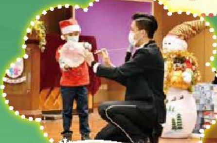
魔術師也來「觀小」和我們歡度聖誕，Mali Mali Home!

雖然大家在疫情下仍然戴着口罩，但並無阻我們歡度這個快樂的節日，透過點唱聖誕歌曲等活動，大家互相送上祝福。我們十分感謝全球性非牟利組織國際十字路會慷慨為全校同學捐出禮物，而家教會委員亦親自為同學們準備精美禮包，讓同學能感受愉快而溫暖的節日氣氛。