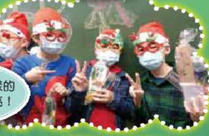
同學都戴上各式各樣的聖誕飾物，十分漂亮！