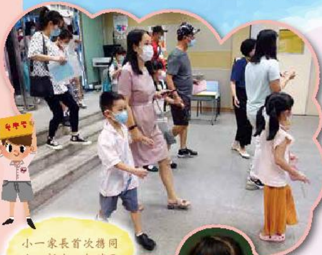
小一家長首次携同小一新生一起踏足「觀小」校園。