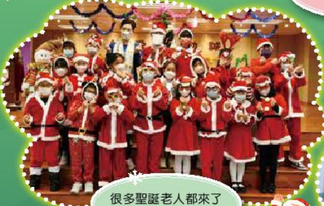
很多聖誕老人都來了「觀小」，真高興！