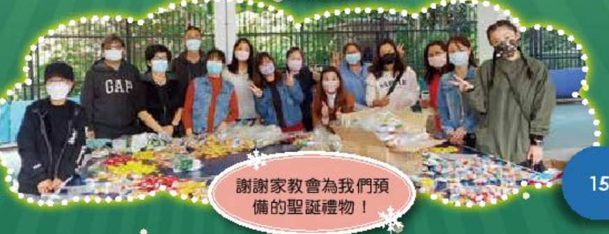
謝謝家教會為我們預備的聖誕禮物！