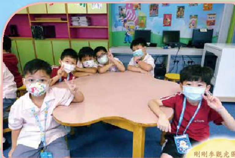
剛剛參觀完圖書館， 同學都表示很想到圖 書館借閱圖書。