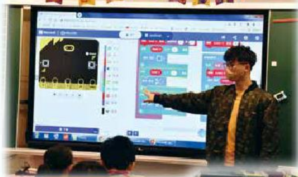
導師教導同學遊戲編程技巧。