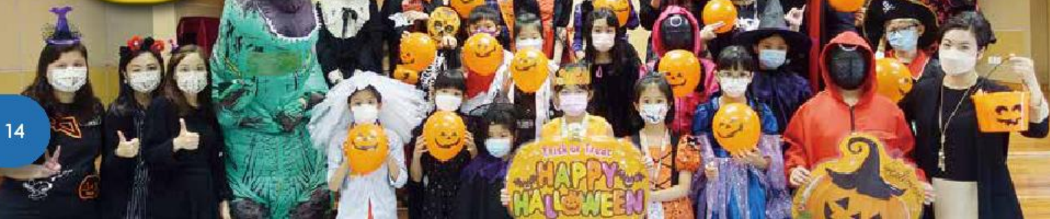
Trick or treat! Don't let the dinosaur get all the candy!