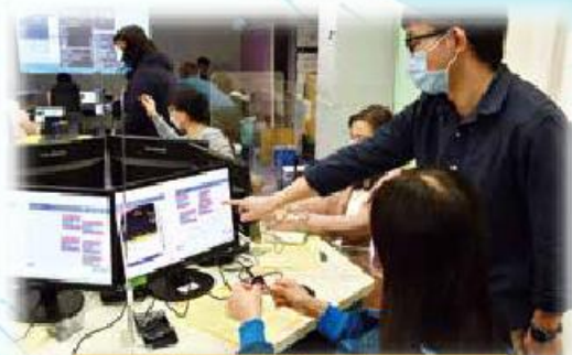
全體老師都專注地進行Micro:bit編程活動。