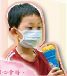
在小一傾心會時，同學都樂於與班主任及同學們分享先自己的小秘密。