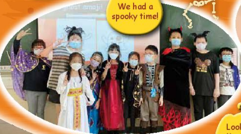
We had a spooky time!