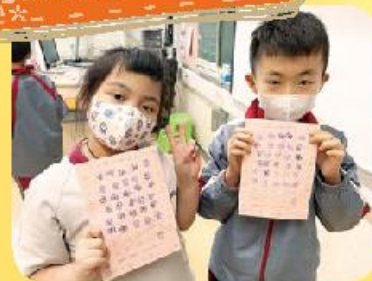
同學展示著超讚「印仔」，繼續努力！