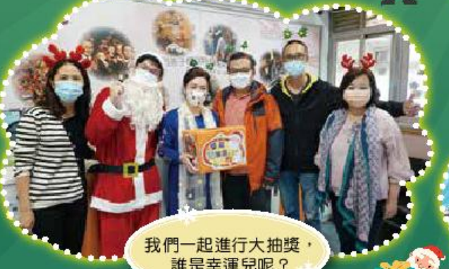
我們一起進行大抽獎，誰是幸運兒呢？