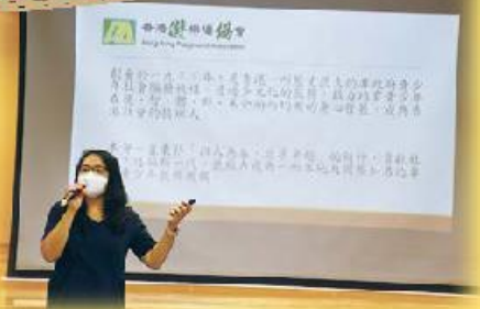
透過家長工作坊，導師介紹提升親子關係的方法和正向溝通技巧。