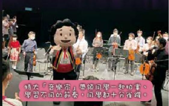
特大「音樂家」帶領同學一起拍掌，學習不同的節奏，同學都十分雀躍。