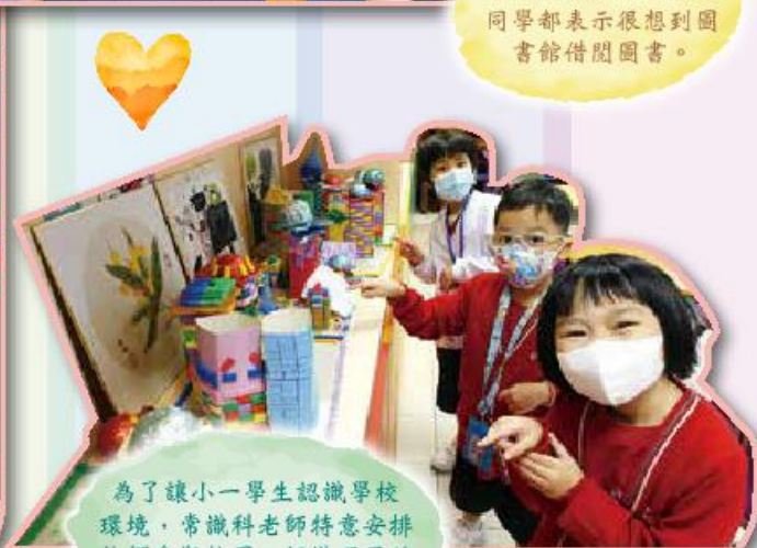
為了讓小一學生認識學校 環境，常識科老師特意安排 他們參觀校園，認識不同的 特別室及設施。