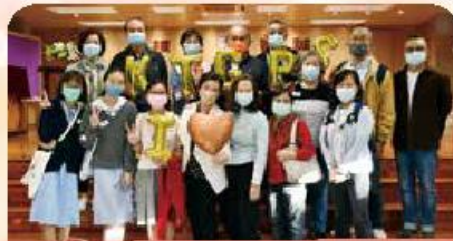
校長+委員+校友齊齊「I Love 觀小」！