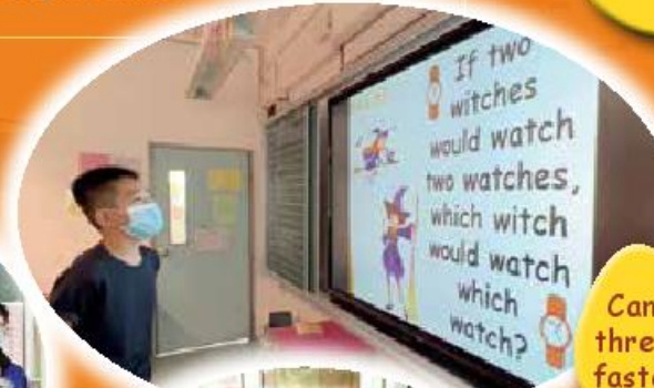
Can you say it three times and faster than me?