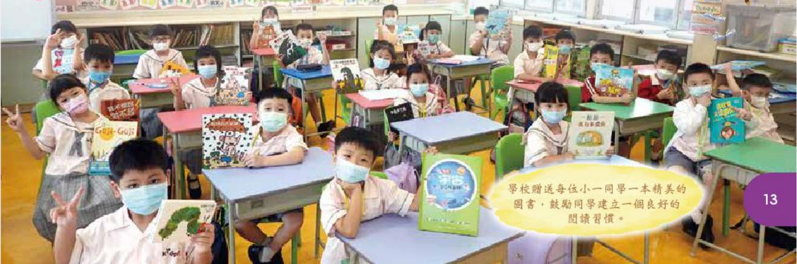
學校贈送每位小一同學一本精美的 圖書，鼓勵同學建立一個良好的 閱讀習慣。