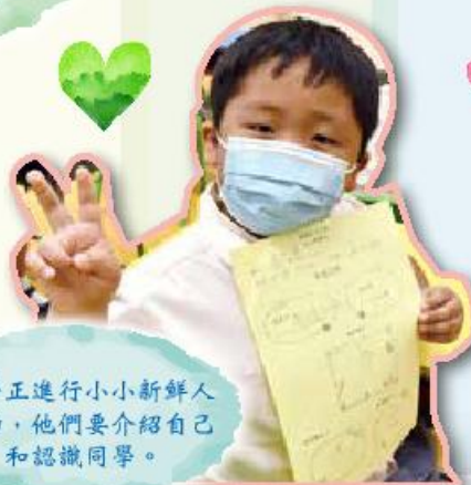
同學正進行小小新鮮人活動，他們要介紹自己和認識同學。