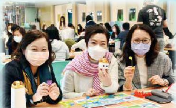
校長和副校長學習不插電編程，都樂在其中。