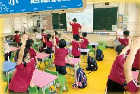
導師以遊戲形式向小一同學教授課堂秩序。