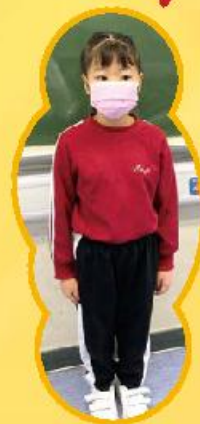
「我的快樂時光」給予同學一個演講平台，分享開心的時刻。這位同學正在分享與家人同遊LEGOLAND的經歷。