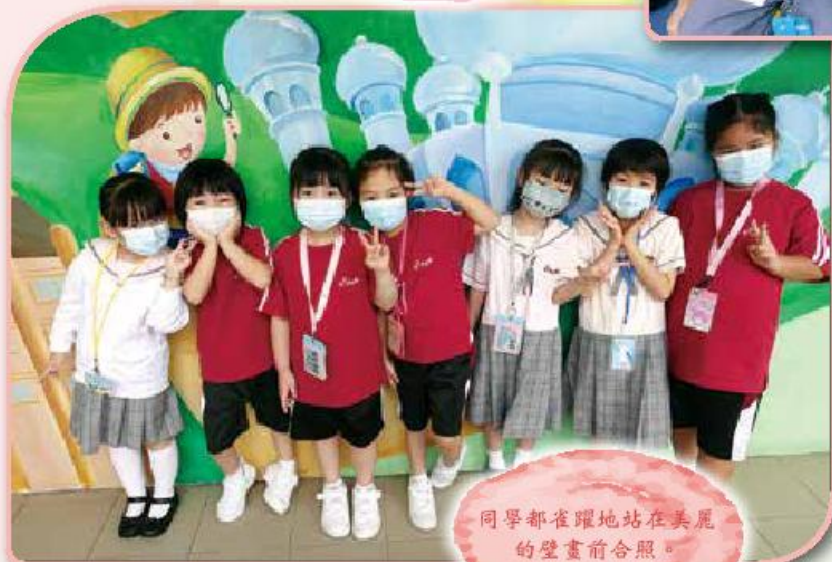
同學都雀躍地站在美麗的 壁畫前合照。