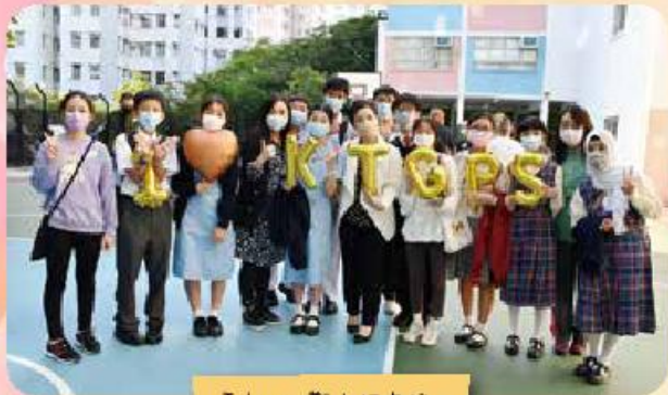
I Love 觀小打卡站。