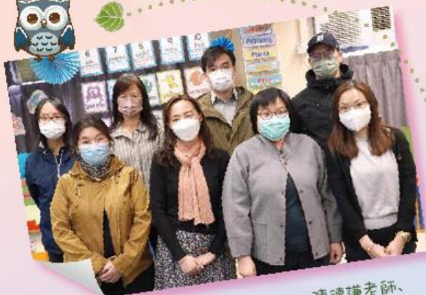
非班主任： 洪翠芬老師、盧茵青老師、李晉怡老師、陳德謙老師、 葉麗英老師、張煥儀老師、何美英老師、梁美琪老師