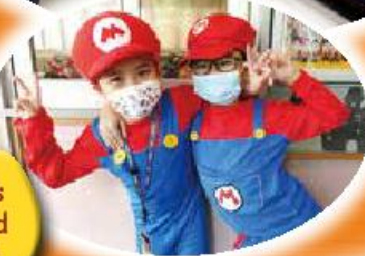
Look! It's Mario and ...Mario!