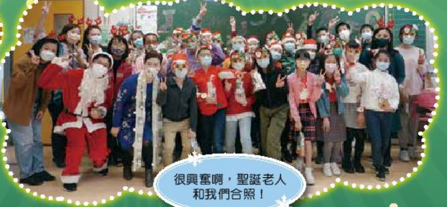
很興奮啊，聖誕老人和我們合照！