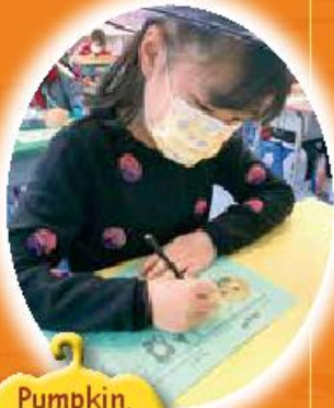
Pumpkin, pumpkin, show me your smile!

On the 29th of October we celebrated with our annual Halloween English Party! Many of our students got dressed up in costumes or spooky colours. Students got into the festive spirit by joining a variety of Halloween activities like singing, making masks, drawing a Halloween emoji and playing English word games. Our most popular game was the tongue-twister!