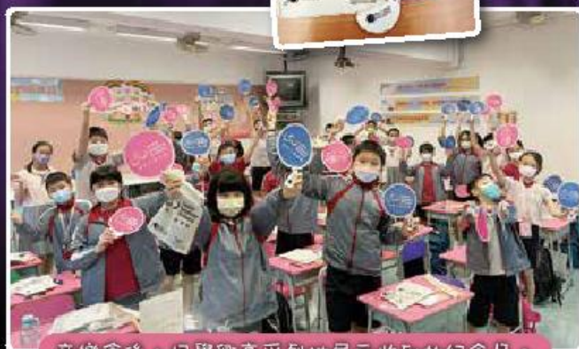
音樂會後，同學興高采烈地展示收到的紀念品。