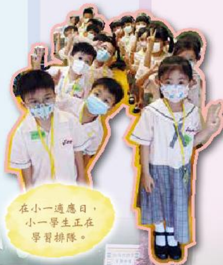
在小一適應日，小一學生正在學習排隊。