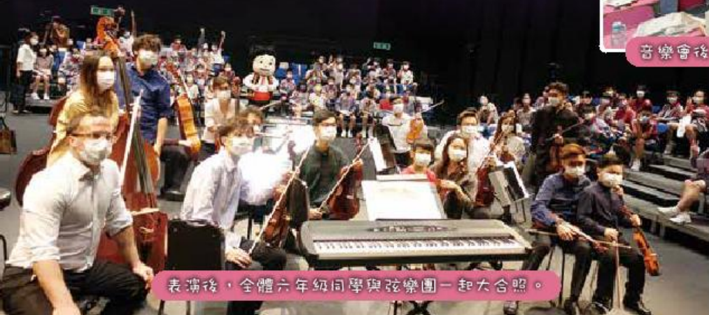
表演後，全體六年級同學與弦樂團一起大合照。