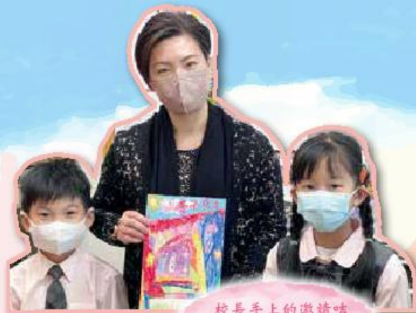
校長手上的邀請咭 是小一同學繪畫的， 多美！