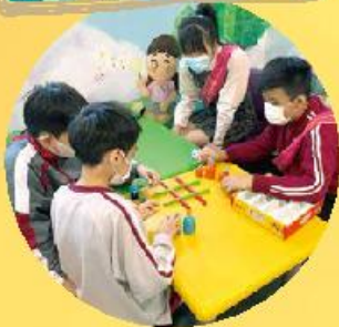
「學生大使」利用小息時間與同學們玩遊戲，輕鬆減壓。