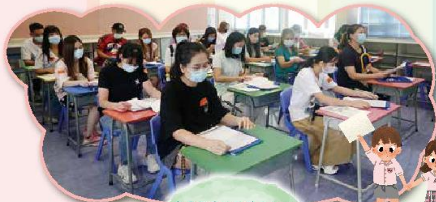
家長認真地聆聽班主任講解，準備協助孩子適應小一生活。