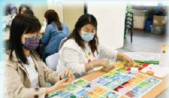
老師嘗試分類不同的不插電編程積木。