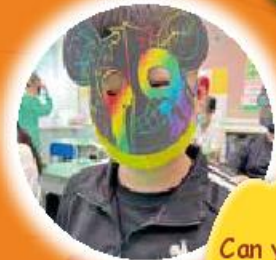
Can you guess who I am?

Our English teachers are always ready to provide more opportunities for students to use English in a fun and authentic way. We hope that everyone enjoyed the party and practiced their English skills!