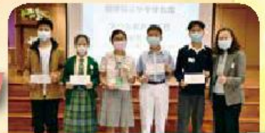
五名剛畢業校友真棒！ 榮獲「STEM-UP 香港創新科技大賽— 最佳演繹大獎」。