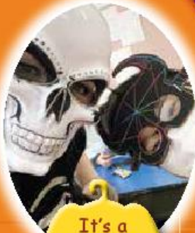
It's a skeleton family!